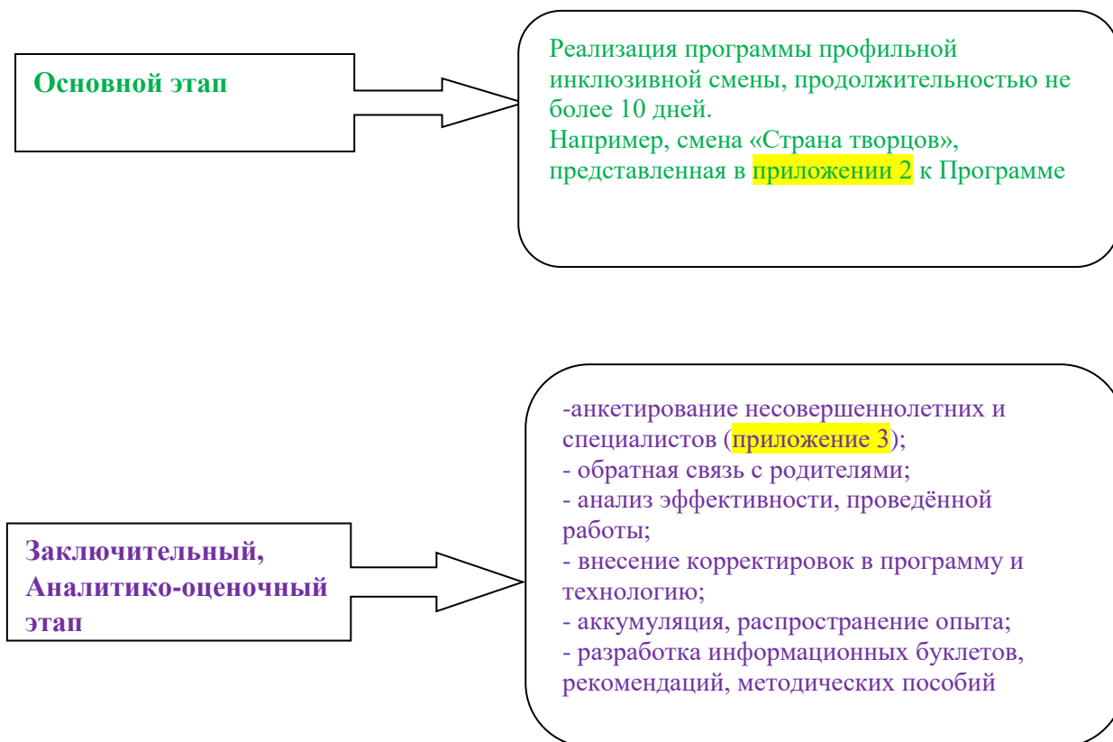
Рисунок 1 - Этапы реализации программы